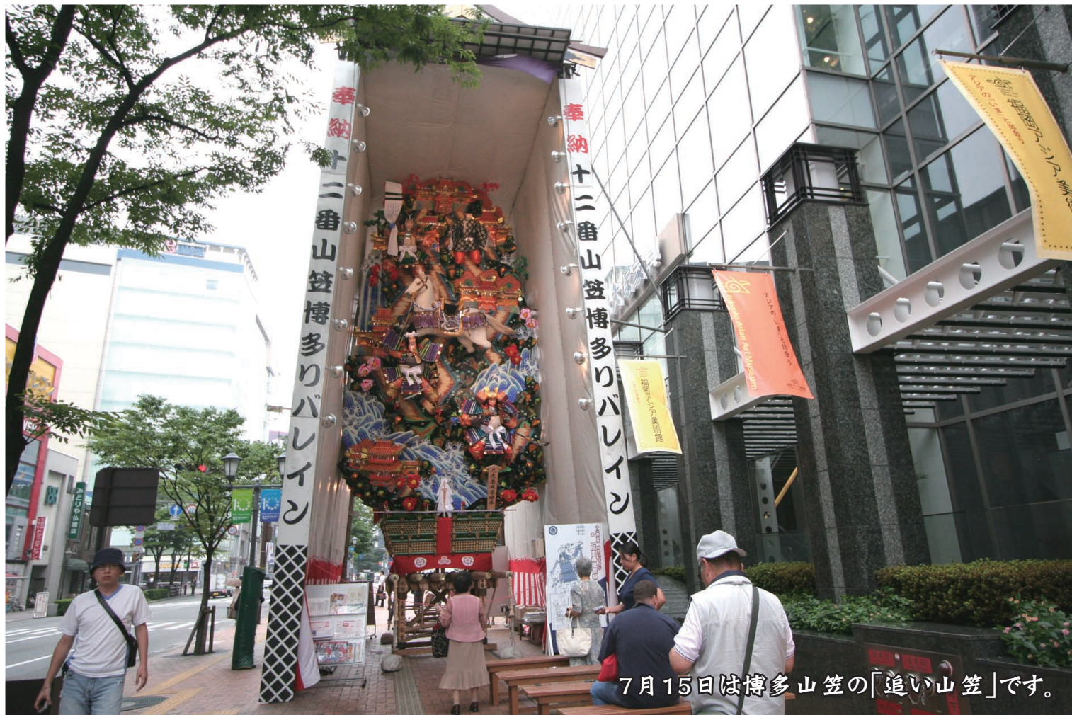
7月15日は博多山笠の「追い山笠」です。

〒812-0027 福岡市博多区下川端町 8-13 電話 0120-391-700 福岡動物病院看護士学院 企画・編集部